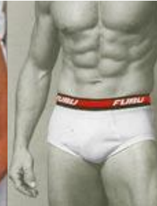
Za spodnje perilo