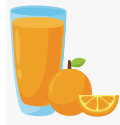
AN ORANGE JUICE