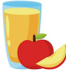
AN APPLE JUICE