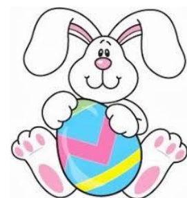
AN EASTER BUNNY