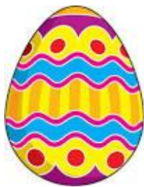
AN EASTER EGG