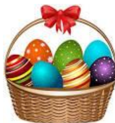
AN EASTER BASKET