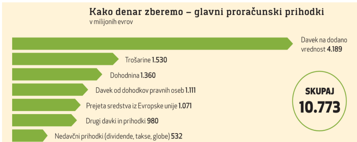
GRAF 1 – NAČRTOVANI PRORAČUNSKI PRIHODKI 2020

Kako država zbira denar in s tem polni proračun oziroma državno blagajno ter za kaj namenja ta denar?