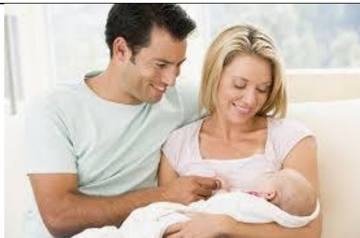
DRUŽINA Z ENIM OTROKOM