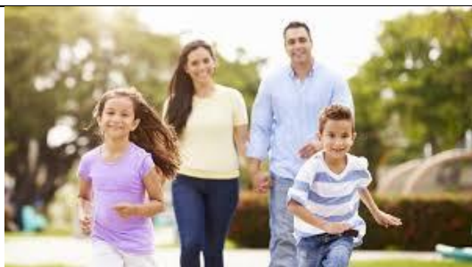
DRUŽINA Z DVEMA OTROKOMA