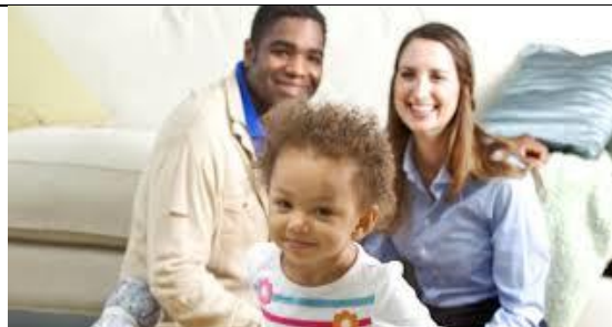
RASNO MEŠANA DRUŽINA

V zvezek SRNICA naj ti starši pomagajo zapisati naslov MOJA DRUŽINA.