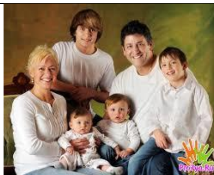
DRUŽINA S ŠTIRIMI OTROKI